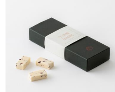
生落雁 加加阿 cacao (大黒屋本店)