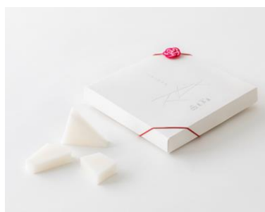
いちまいのみず (京菓子司 亀広良)