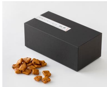
名古屋ひつまぶしあられ (あられの匠 白木)