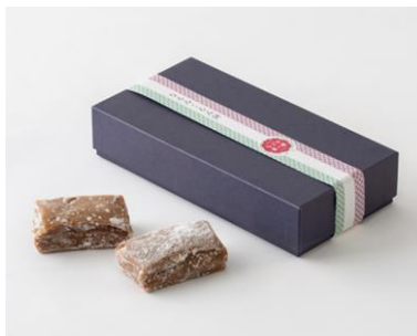
なるみくろみ餅 黒糖 (山田餅なるみ)