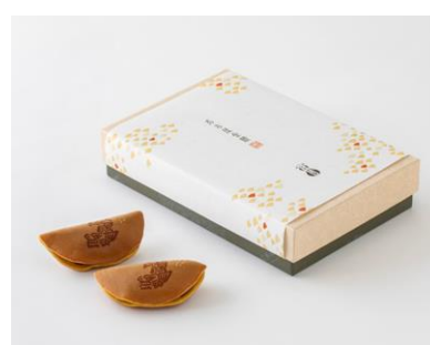
名古屋金鯰(菓子処 大口屋)