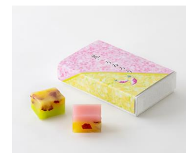
鬼うめろう(両口屋是清)