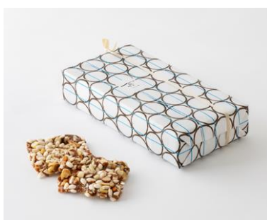
木の实のおこし(一朶)